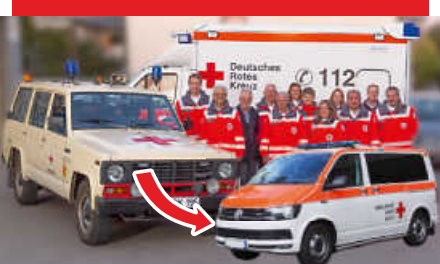
Plakat: DRK Gärtringen