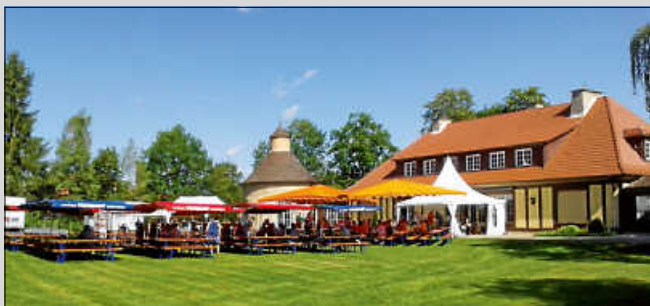
Aufnahme von 2017

In der idyllischen Umgebung des Kiefer-Parks der Villa Schwalbenhof im Zentrum von Gärtringen findet dieses Jahr wieder die beliebte Jazz-Matinée statt und zwar am