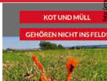
KOT UND MÜLL GEHÖREN NICHT INS FELD!