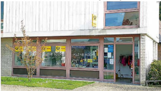
In diesen Räumlichkeiten im Rathaus Rohrau wird „Tante M“ künftig zu finden sein

Bei Interesse oder Rückfragen wenden Sie sich bitte an Moritz Eckhard unter 07034 923-119 oder eckhard@gartringen.de , oder zum Thema Tante-M an Ortsvorsteher Torsten Widmann unter 07034 923-210 oder widmann@gartringen.de