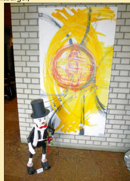
Rohrauer Nacht

Wenn Sie sich selbst gerne aktiv im kommenden Jahr beteiligen wollen, laden wir Sie herzlich ein am