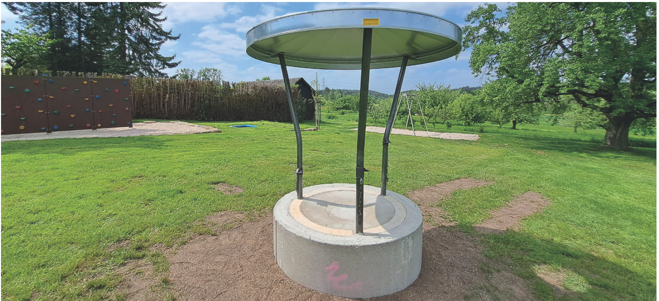
Grillen mit Blick auf das Heckengäu im Schatten der Schwarzwaldhalle.