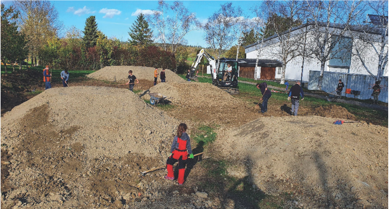
Die Helfer beim Bau der Dirtbahn