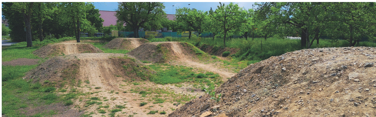
Die Dirtbahn mit einem Startturm und zwei Bahnen mit jeweils 2 Sprunghügeln, ist das Herzstück des Freizeitgeländes.