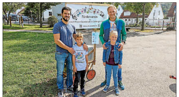
Bereit zum Eisverkauf