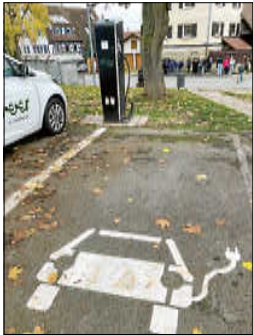
Ladesäule am Rohrweg

Bereits 2016 wurden die ersten beiden öffentlichen Ladesäulen mit je zwei Ladepunkten und 22 kw Leistung von der Gemeinde in der Gärtringer Ortsmitte auf dem Parkplatz neben der Kreissparkasse und auf dem Parkplatz neben dem Dorfplatz in Rohrau errichtet. Betrieben werden sie von der EnBW.