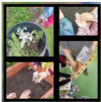
Bepflanzung von Samen und Kräutern

In einem Stuhlkreis erklärten Magda und Dora den Kindern alles rund um die Erdhummel. Anhand von Bildern zeigten sie den Kindern eindrücklich, wo diese Tiere leben und was sie fressen. Den Kindern wurde klar, dass es ohne Bienen weder Blumen noch Obst und Gemüse geben würde. Dazu boten die Pädagoginnen Holzobst/-gemüse sowie selbstgehäkelte Hummeln zum Tasten an. Im Anschluss durften die Kinder mit Nektar, Gieß-